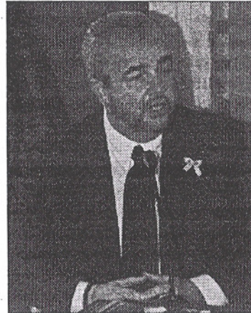
Ambiente Giancarlo Tei

Attualmente nella discarica funzionano due impianti di trattamento. Uno è il depuratore del percolato, realizzato per trattare 34mila metri cubi all'anno e che produce uno scarto di 8500 metri cubi annui.